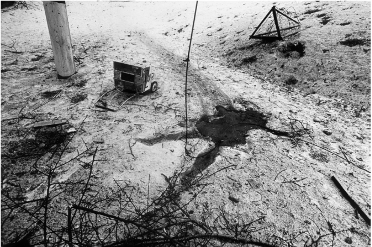
Groznyj, Tchétchénie, janvier 1995, de la série Open Wound, 1994-2003.