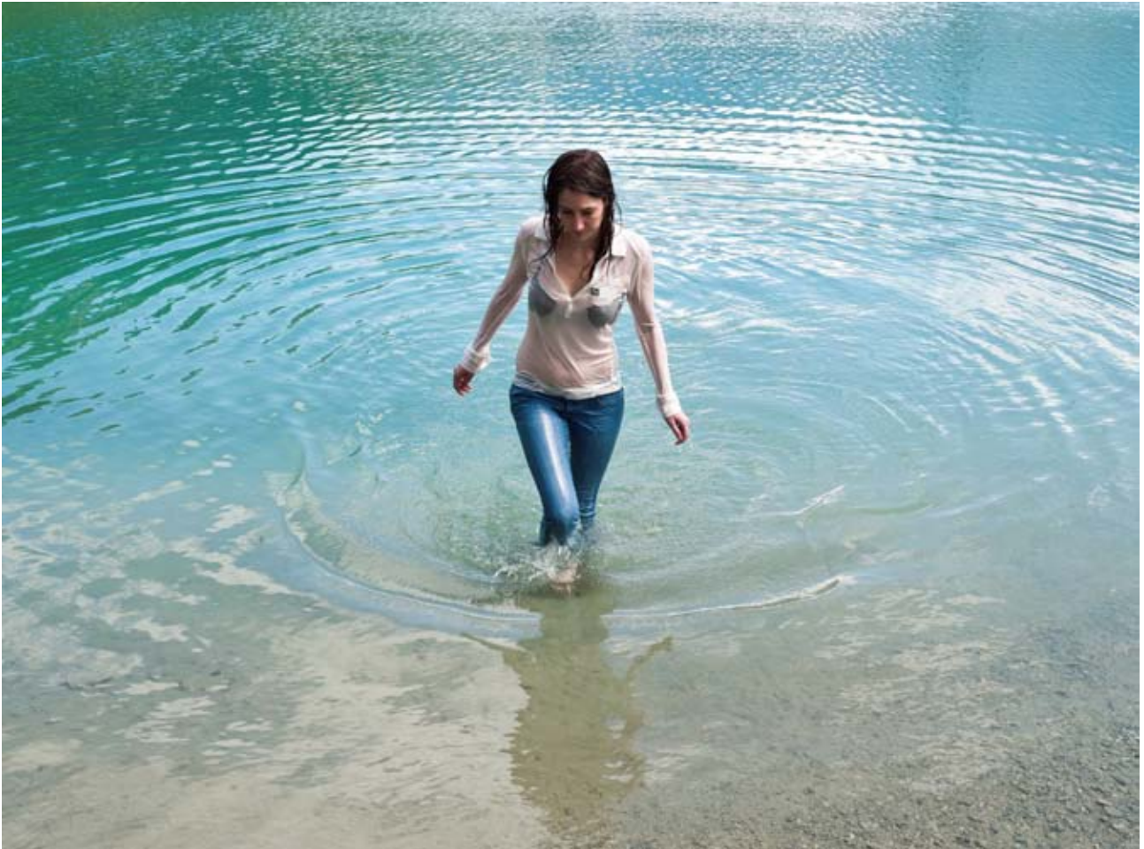
Olivier Lovey, Sans titre , de la série Animic Plastic , 2011. CEPV