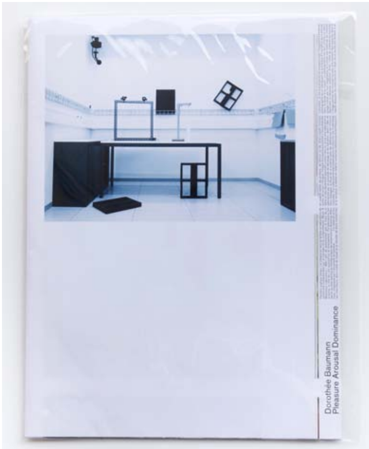
Dorothee Baumann, Pleasure Arousal Dominance , 2011, couverture