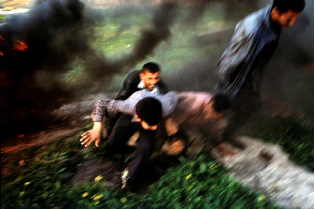
Stanley Greene, Explosion sur la route de Kirkouk , Irak, avril 2004. Courtesy Noor Images, www.noorimages.com © Stanley Greene