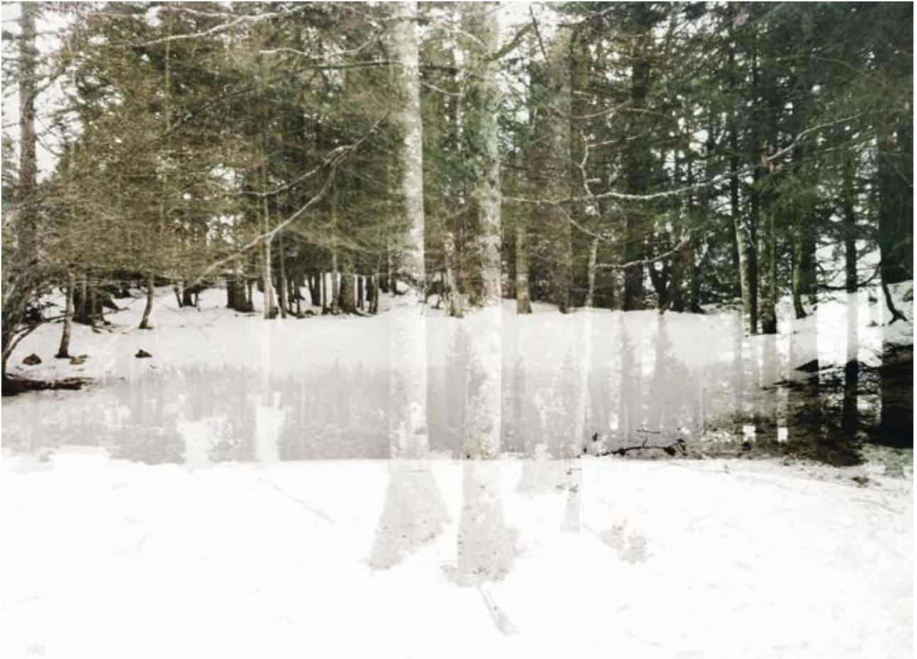
Carine Roth, Sans titre , 2012 © Carine. Roth / Realeyes