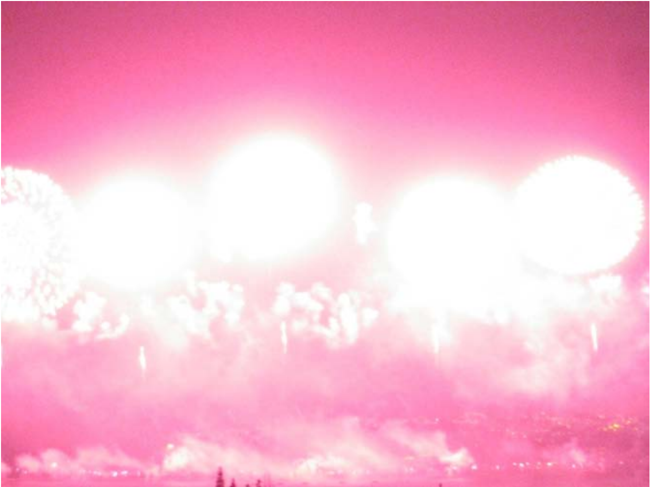
Graziella Antonini, Sans titre , de la série Peony Heaven , Chine, octobre 2009